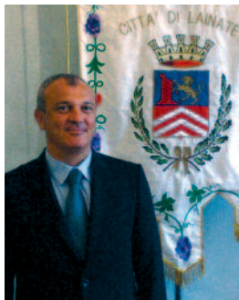
Alberto Landonio Sindaco di Lainate

Vi sono degli argomenti che faticano a fare breccia all'interno dell'interesse collettivo, quasi che si tratti di questioni riservate solo a quelle persone che, loro malgrado, si trovano a vivere situazioni di difficoltà, disagio, emarginazione. Mi riferisco, in particolare, alla tematica dei cosiddetti "servizi alla persona", che più genericamente siamo soliti catalogare con il termine "servizi sociali".