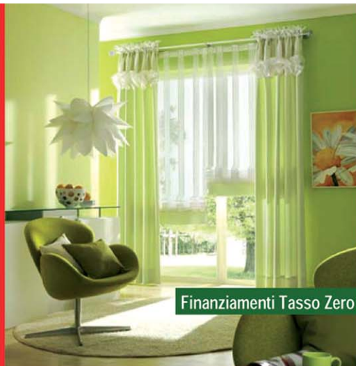
Finanziamenti Tasso Zero

Esposizione Via Madonna 4 Lainate (MI) 029370967