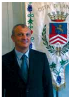
Alberto Landonio Sindaco di Lainate

La fine dell'anno solare è, da sempre, l'occasione per tracciare bilanci ed elencare auspici per l'anno che sta per iniziare, con la consapevolezza che non c'è miglior modo per ricominciare con forza che quello di guardare al passato, per evitare di ripetere errori e prendere spunto dalle cose belle che si sono vissute o che sono state programmate.