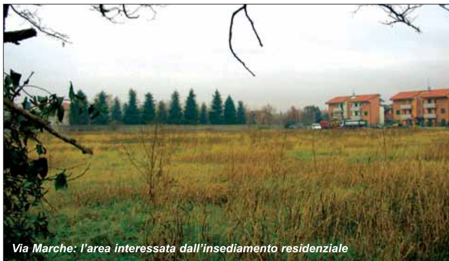
Via Marche: l'area interessata dall'insediamento residenziale