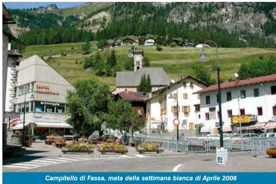
Campitello di Fassa, meta della settimana bianca di Aprile 2008

Il Tennis Club Lainate chiude l'anno rieleggendo il Consiglio