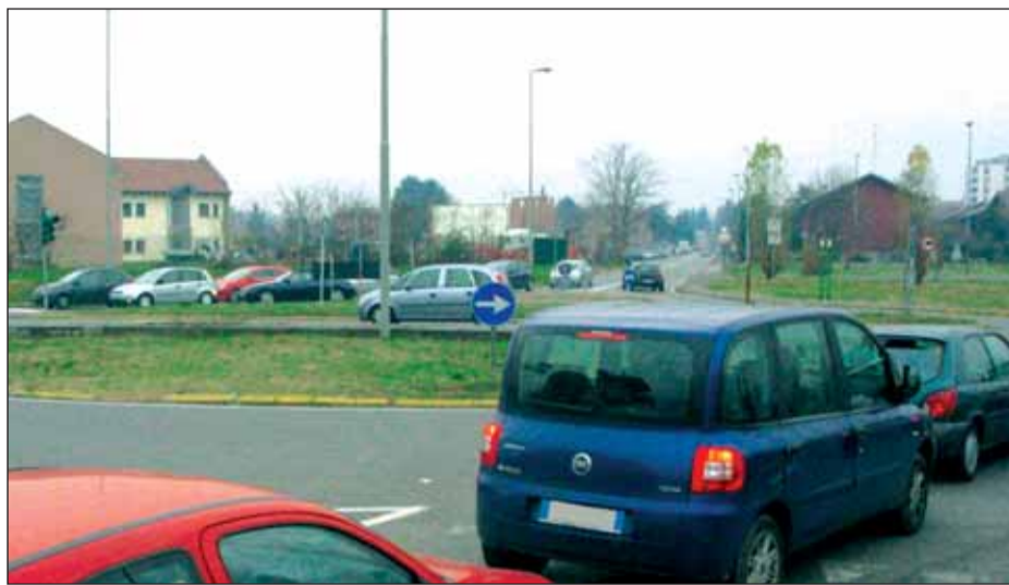
Incrocio di via Marche: il semaforo sarà sostituito da una rotonda

I moduli, debitamente compilati, possono essere consegnati al Punto Comune di Lainate (Largo Vittorio Veneto, 16) e di Barbaiana (nel Centro civico di piazza della Vittoria, 1).