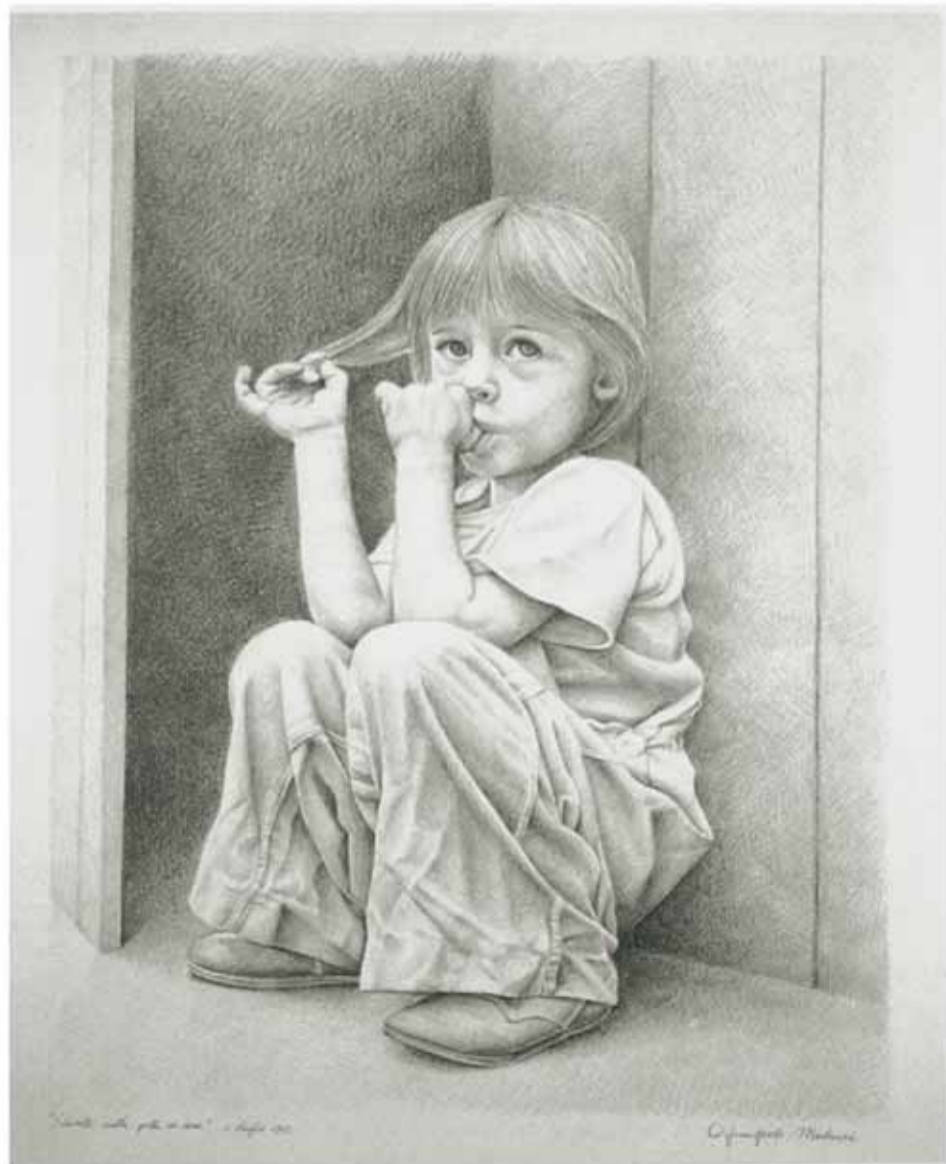
Giampaolo Muliari: "Serenità sulla porta di casa", matita su carta, 1992

Se guardi bene le piccole cose.. trovi le grandi, le meravigliose