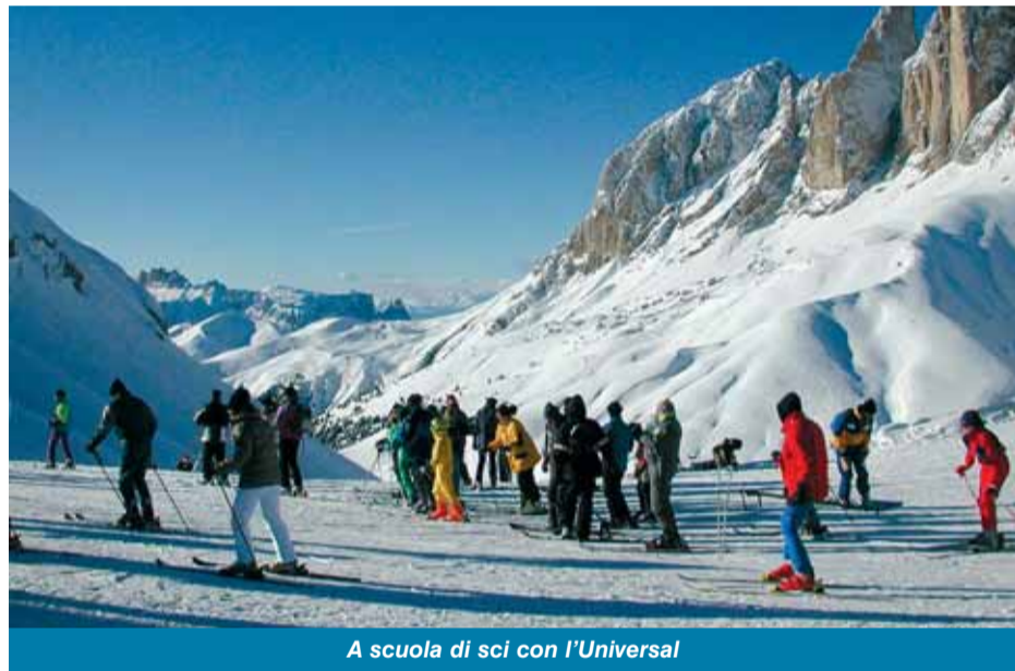
A scuola di sci con l'Universal